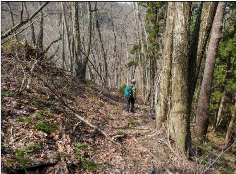
No.: 8 場所: 高沢～休石古道 測点: ⑧