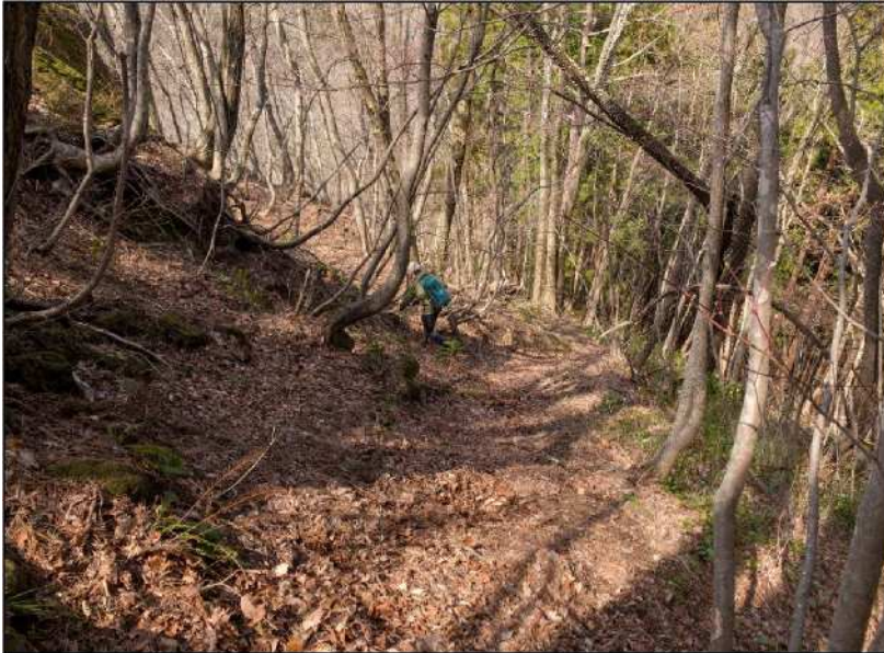
No.: 7 場所: 高沢～休石古道 測点: ⑦