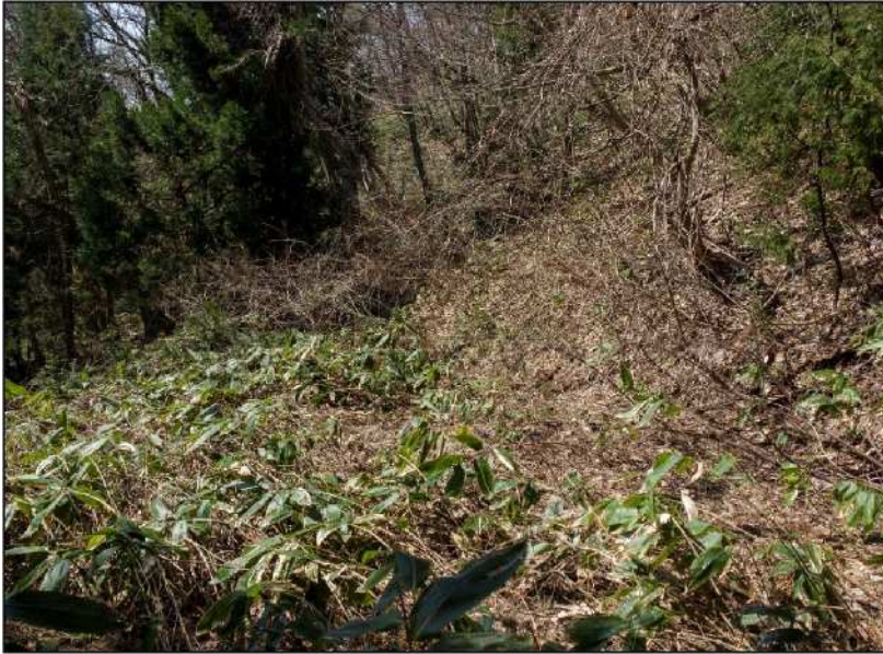
No.: 4 場所: 高沢～休石古道 測点: ④