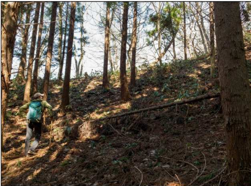
No.: 5 場所: 高沢～休石古道 測点: ⑤