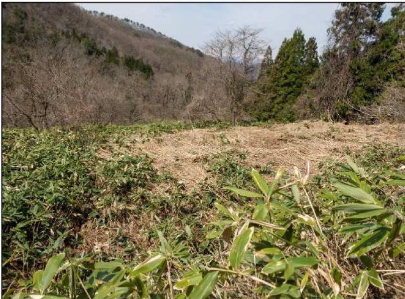
No.: 11 場所: 高沢～休石古道 測点: ⑪