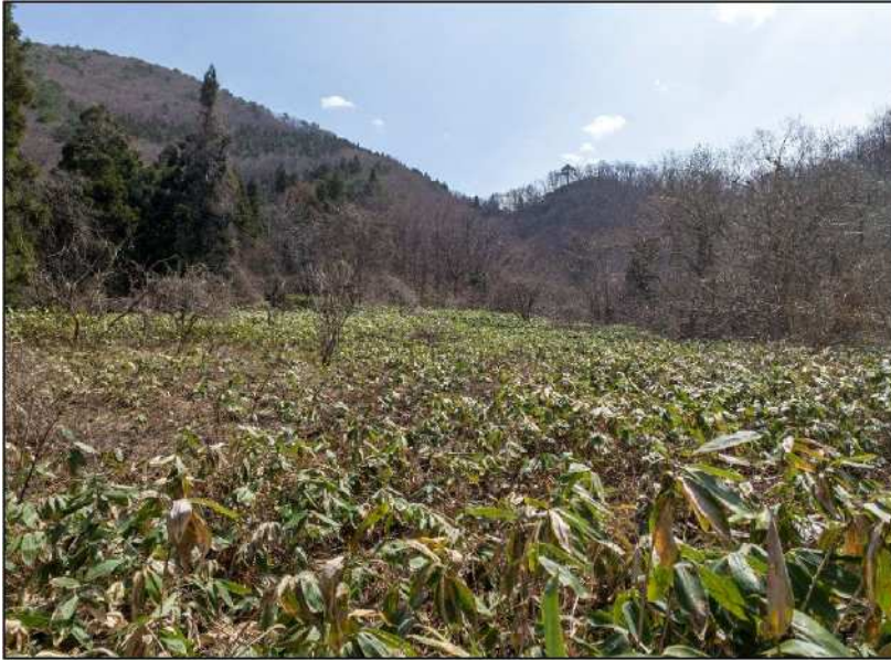
No.: 13 場所: 高沢～休石古道 測点: ⑬