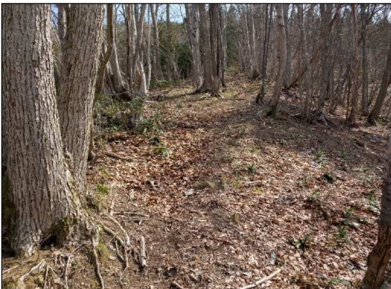
No.: 6 場所: 高沢～休石古道 測点: ⑥