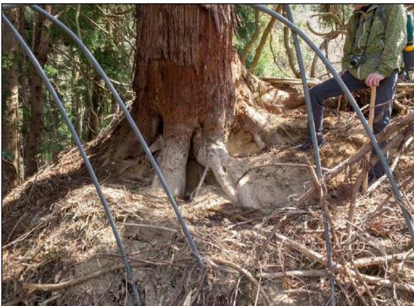
No.: 12 場所: 高沢～休石古道 測点: ⑫