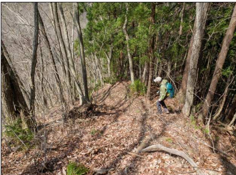
No.: 9 場所: 高沢～休石古道 測点: ⑨