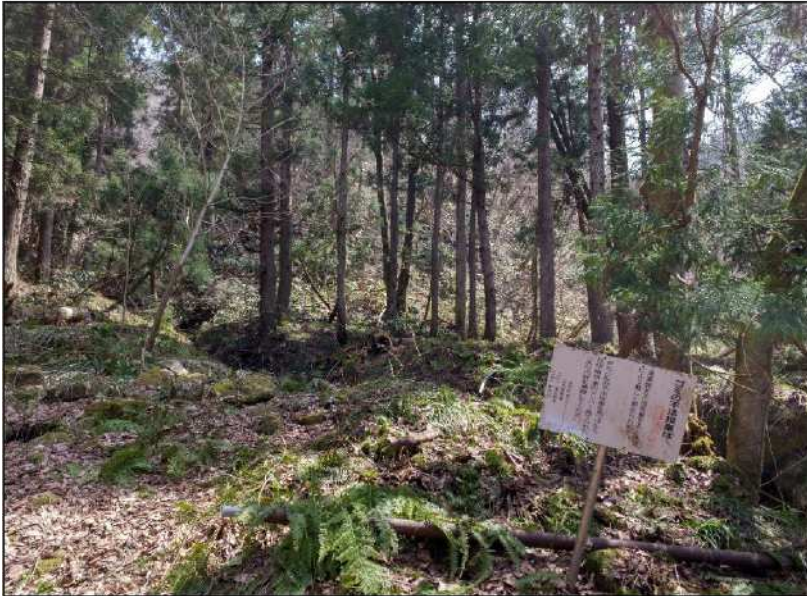
No.: 14 場所: 高沢～休石古道 測点: ⑭