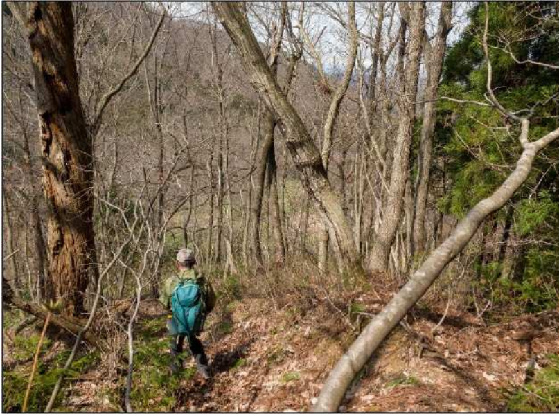
No.: 10 場所: 高沢～休石古道 測点: ⑩